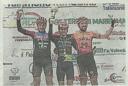
PODIO I primi tre assoluti